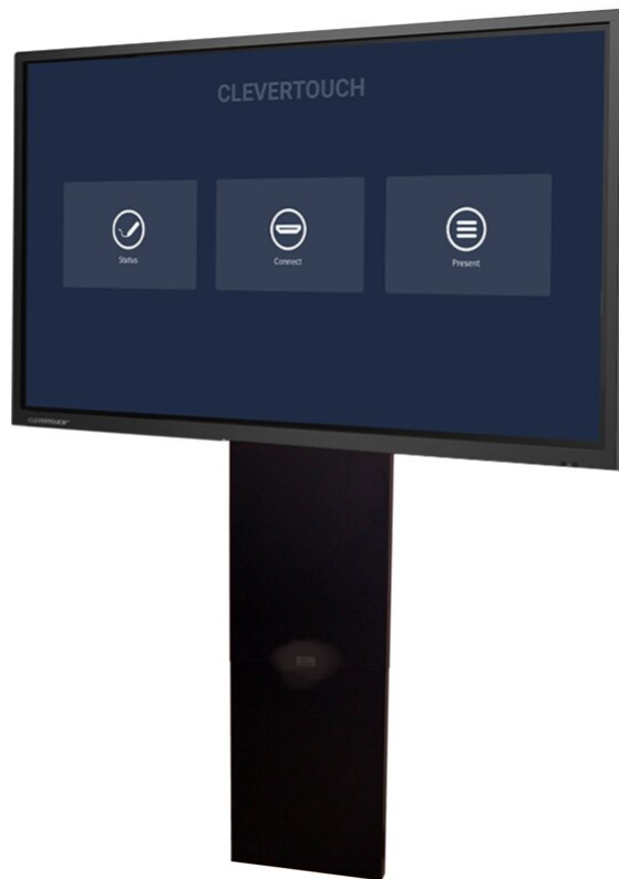
Abbildung mit Clevertouch UX PRO 86"