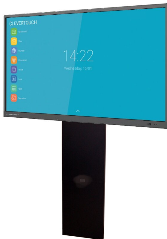
Abbildung mit Clevertouch Impact PLUS"